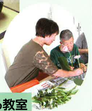
ボランティアによる教室