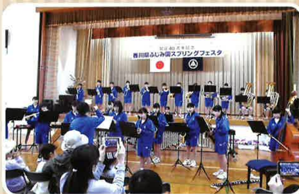
飯山中学校吹奏楽部