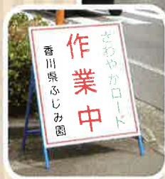
さわやかロード事業