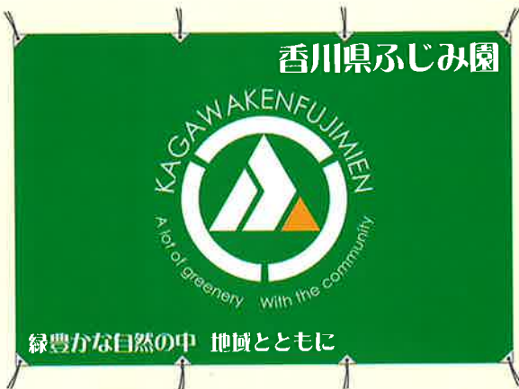
香川県ふじみ園 フラッグ作成