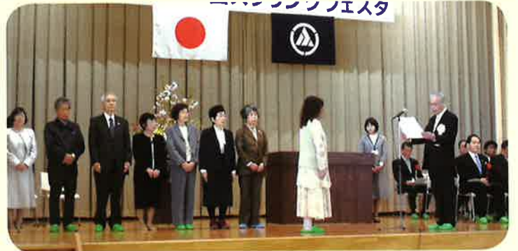
ボランティアなどで運営に長年貢献した 9団体・個人に感謝状贈呈