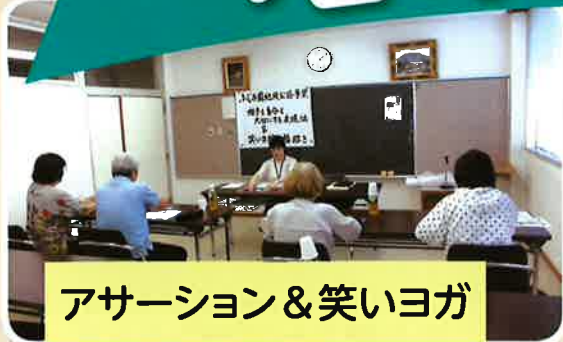
アサーション&笑いヨガ