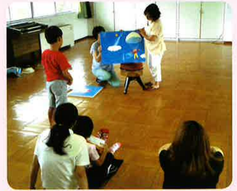
読み聞かせボランティア