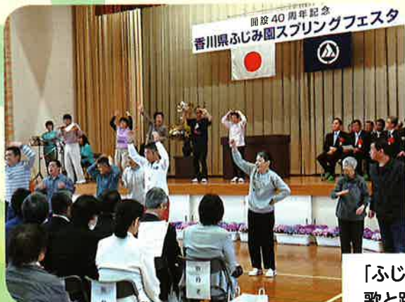
「ふじみの歌」 歌と踊りの発表