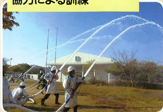
地域の消防署や警察署の協力による訓練