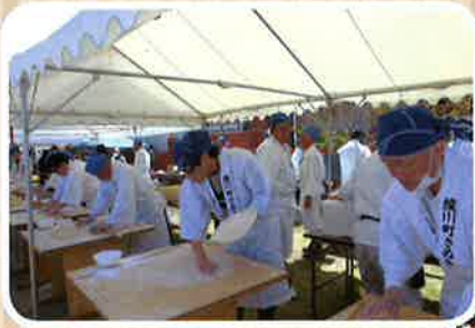
綾川町うどん研究会