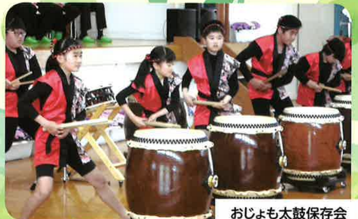
おじよも太鼓保存会によるオープニング