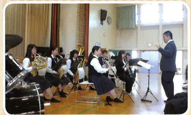
飯山高等学校吹奏楽部