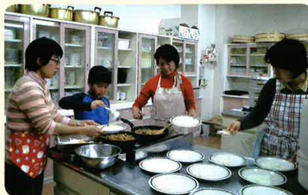
パクパクスマイル